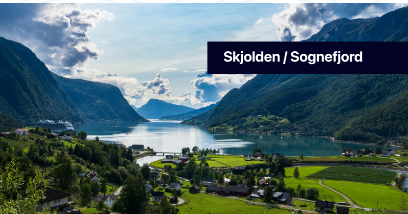
Skjolden / Sognefjord